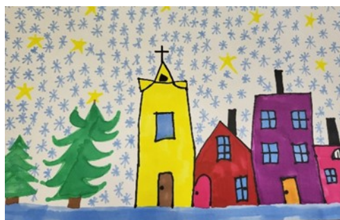
T. Župan – PŠ Bapska, 2. r. (Zima – flomaster)