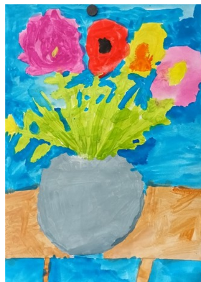
I. Hyrych, 3.r. (Cvijeće u vazi - gvaš tehnika)