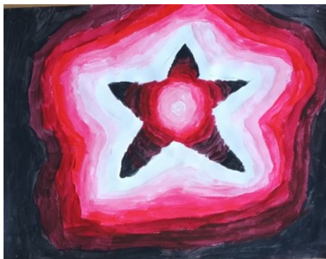
P. Rukavina, 5. r. (Sjajna zvijezda – tonska gradacija)