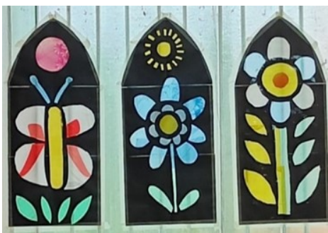
8. razred (Vitraj – svjetlosna instalacija)